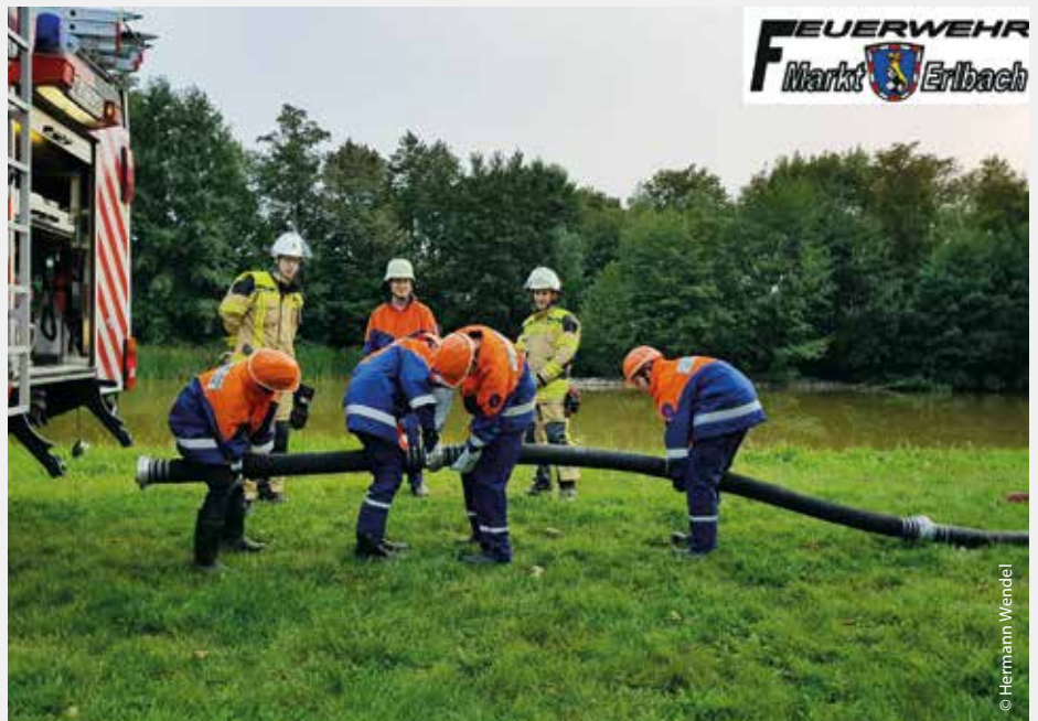
Für den Ernstfall gut vorbereitet: die Freiwillige Feuerwehr Markt Erlbach

Dabei entstehen neben den „alteingesessenen“ Vereinen wie dem 1871 gegründeten Feuerwehrverein Markt Erlbach auch immer wieder neue Vereine – zuletzt der Deutsch-Französische Partnerschaftsverein Freunde Panazols e. V. im Jahr 2012. Manche zählen über tausend