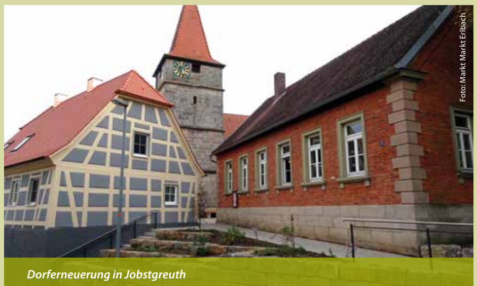
Dorferneuerung in Jobstgreuth

Freuen dürfen wir uns in diesem Jahr wieder auf unser zweitägiges Marktfest, bei dem wir auch das fünfjährige Jubiläum unserer Städtepartnerschaft mit Panazol feiern werden.