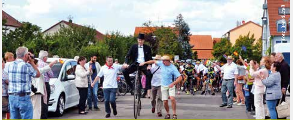
Empfang der Radgruppe aus Panazol und Picanya

Der AWO Bezirksverband Ober- und Mittelfranken, der in Markt Erlbach bereits ein Wohnheim für Langzeitkranke betreibt, ist Träger unseres modernen Seniorenpflegeheims. Der Standort zwischen der Ansbacher Straße und dem Breiten Rain ist inmitten der Wohnbebauung sehr zentrumsnah gelegen. Alle Infrastruktureinrichtungen wie Rangauhalle, Kirche, RangauBad und Einkaufsmöglichkeiten sind gut fußläufig er-