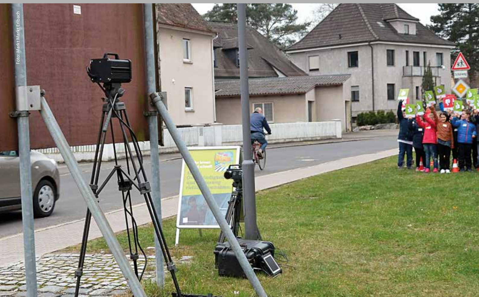
Verkehrserziehung im Markt Markt Erlbach