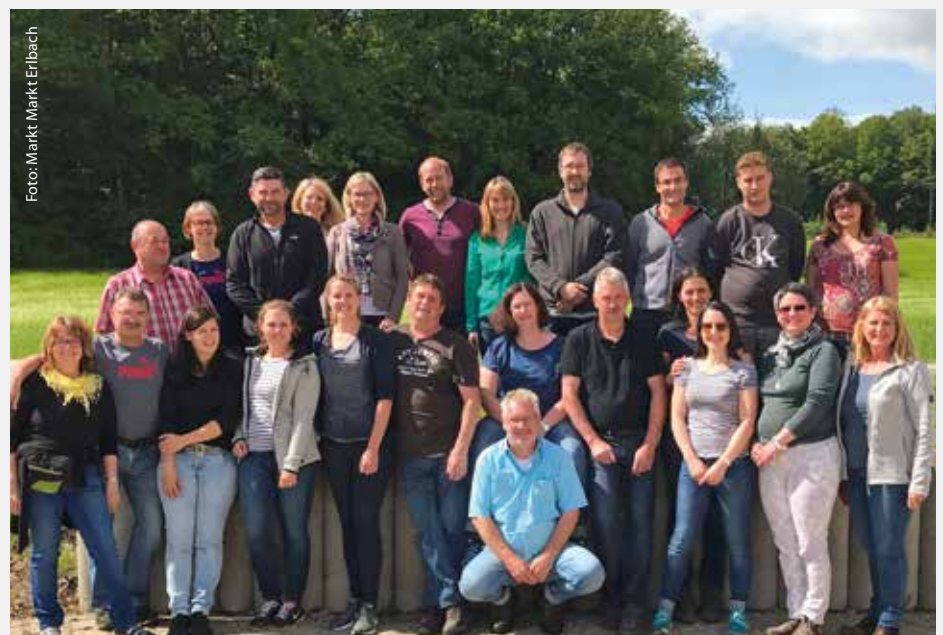
Die Mitarbeiter der Marktgemeinde und der Zweckverbände