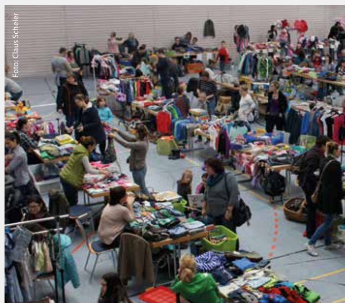
Kinderbasar in der Rangauhalle